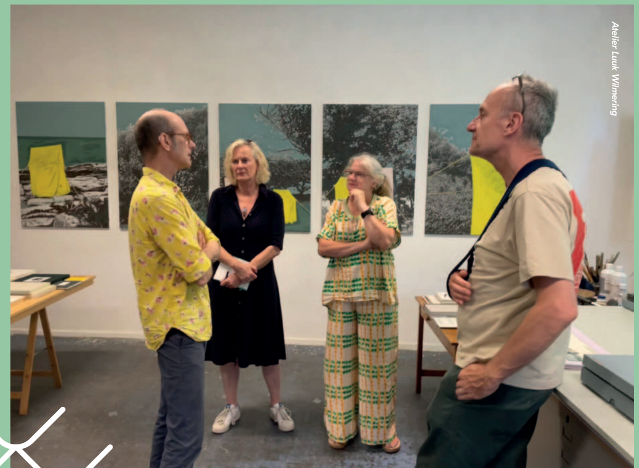
Atelier Luuk Wilmering

Ook binnen haar schilderijen valt veel te beleven. Haar schilderstreek is sterk, haar beeldtaal is nu eens formeel, dan weer anekdotisch en verhalend. Bonsma navigeert van abstract naar figuratief, van sprookjesachtig en dromerig tot puur kleur en verfstreek. Bij Bonsma kan wat klein is groot worden en omgekeerd. Een klosje garen, gevonden op straat, kan uitgroeien tot een symbolisch object van monumentale proporties.