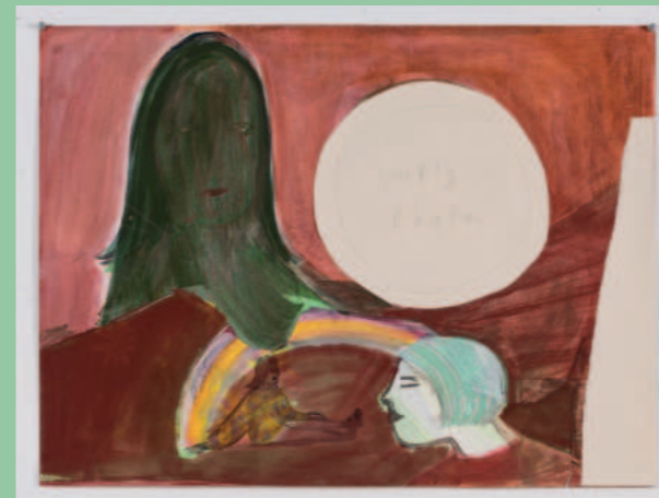
Corinne Bonsma, Empty Plate, 2023